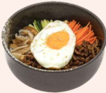
BIBIMBAP CON TERNERA