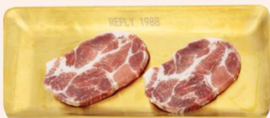
AGUJA DE CERDO