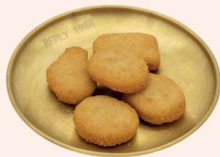
NUGGETS DE POLLO