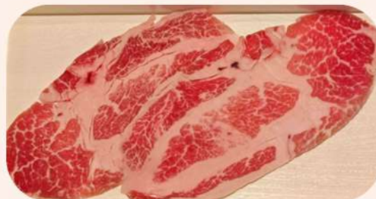
AGUJA CERDO IBÉRICO