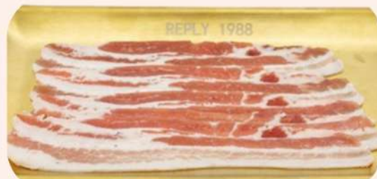
PANCETA CORTE FINO