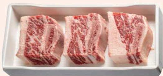
CHURRASCO DE ANGUS