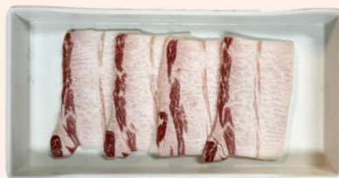
PANCETA IBÉRICA ADOBADA