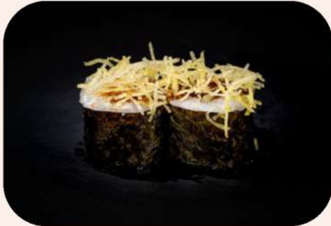
MAKI LANGOSTINO TEMPURA