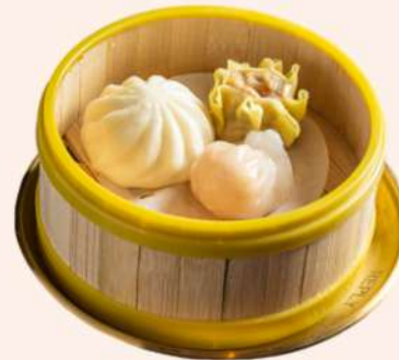
DIM SUM VARIADO