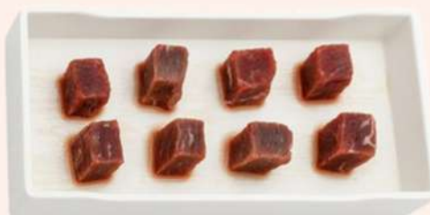
DADITOS DE TERNERA