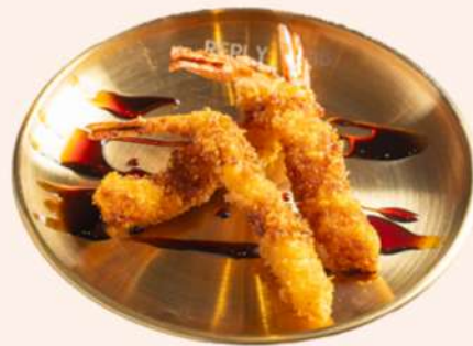
TEMPURA DE LANGOSTINO