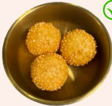
BOLITAS DE SÉSAMO