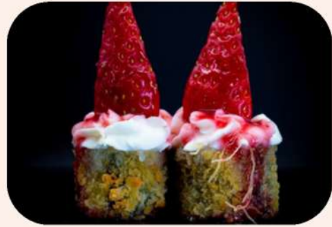
MAKI TEMPURIZADO FRESA