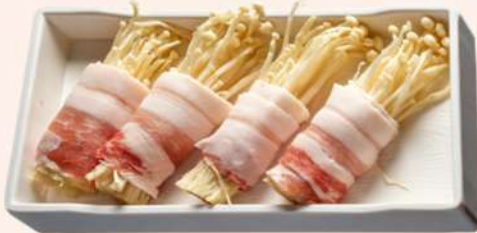
ENOKI CON PANCETA