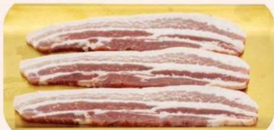
PANCETA CORTE GRUESO