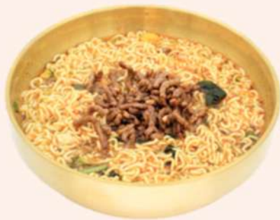
RAMEN CON TERNERA