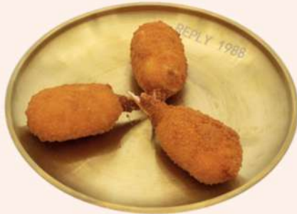
MUSLITOS DE CANGREJO