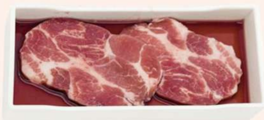
AGUJA EN VINO TINTO