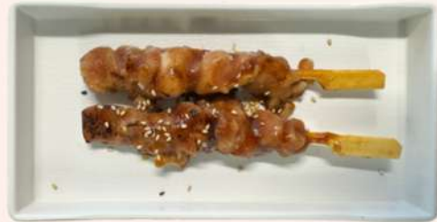
PINCHO DE POLLO EN SALSA