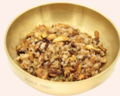
ARROZ FRITO CON TERNERA