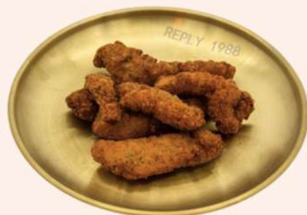
TIRAS DE POLLO