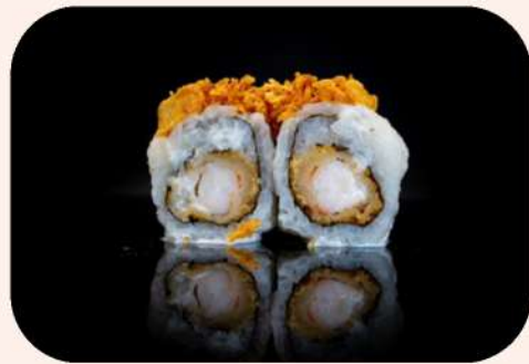
URAMAKI LANGOSTINO TEMPURA