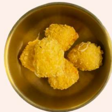
BOLITAS DE QUESO