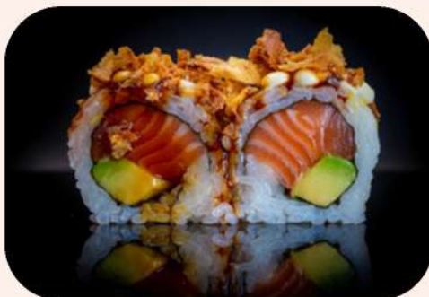
URAMAKI SALMÓN CEBOLLA