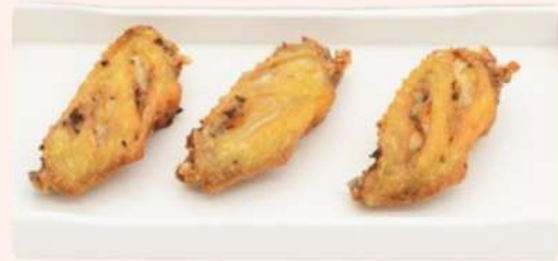
ALITAS DE POLLO