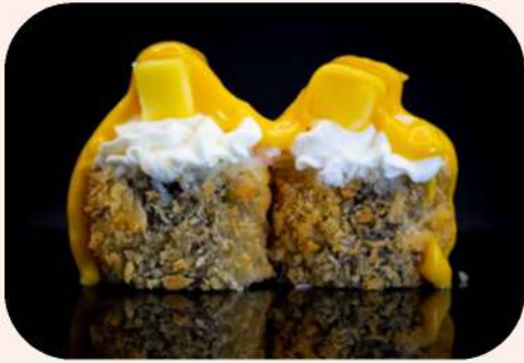
MAKI TEMPURIZADO MANGO