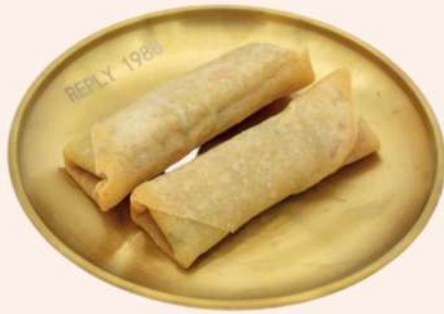
ROLLITOS DE PRIMAVERA