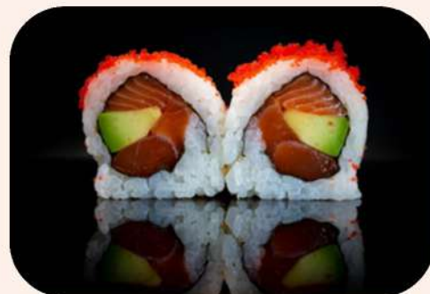
URAMAKI SALMÓN TOBIKO