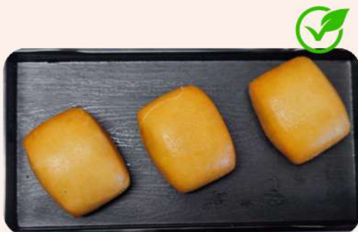
PAN CHINO FRITO