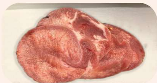
LENGUA DE AÑOJO