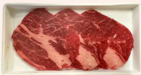
AGUJA DE TERNERA