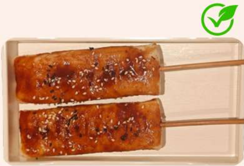
BROCHETA DE PASTA DE ARROZ