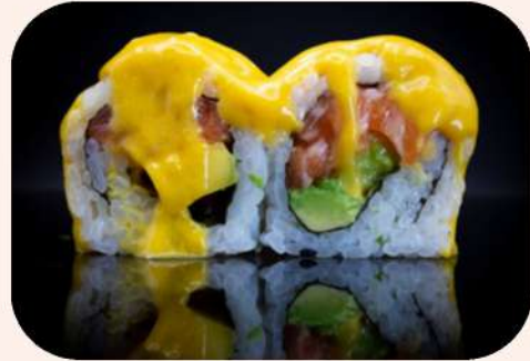
URAMAKI SALMÓN MANGO