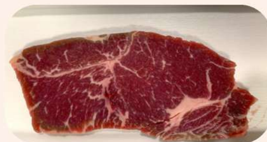
ENTRECOT DE TERNERA