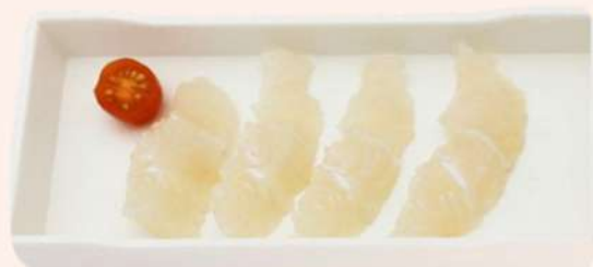
FILETE DE PANGA