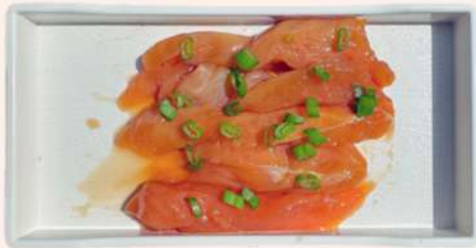
PECHUGA DE POLLO EN SALSA