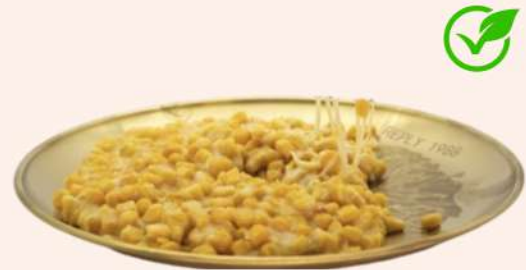
MAÍZ CON QUESO