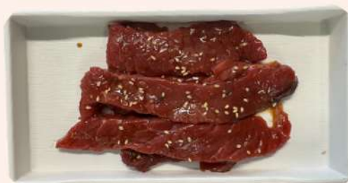
TERNERA EN SALSA