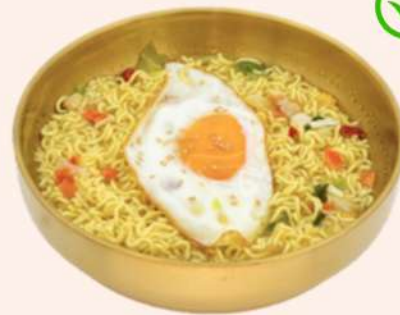
RAMEN CON HUEVO